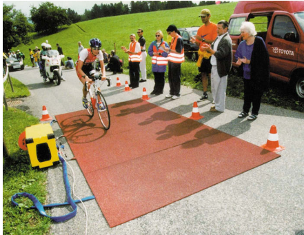
Zeitmessung bei der Duathlon-WM "Powerman" in Zofingen/Schweiz (Datenübertragung mit TiMo II Funkmodem)

Der Anwender kann zwischen einer 10 mW Version mit kostenloser Allgenehmigung (ISM-Band) wählen und einer 500 mW (ISM-Band, Fernwirkband und Nichtöffentlicher Datenfunk) bzw. 6 W (Nichtöffentlicher Datenfunk) Version. Sie erfordern im Vergleich zu anderen Kommunikationsmedien nur sehr niedrige Zugangsgebühren, z.B. DM 2,25 pro Monat im Nichtöffentlichen Datenfunk (Stand 1999). Die Betriebskosten (bis auf die minimale Stromversorgung) sind also unabhängig vom übertragenen Datenvolumen und der Übertragungszeit; darüber hinaus fällt nur eine einmalige Anmeldegebühr an (die Angaben gelten nur für Deutschland).